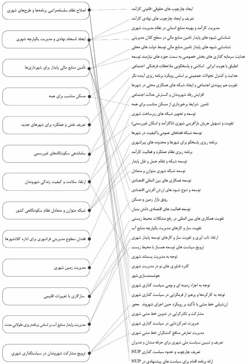
شکل ۱ - ارتباط میان مضامین سازمان دهنده و اولویت‌های موضوعی سیاست ملی شهری.

در ادامه به شرح مختصری از هر یک از حوزه‌های موضوعی که می‌بایست در تدوین سیاست ملی شهری مورد توجه قرار گیرند پرداخته شده‌است. این موضوعات در سه گروه کلی به شرح نمودار ۱ قابل طبقه‌بندی هستند. این طبقه‌بندی علاوه بر معرفی یک ساختار کلی برای شناخت بهتر موضوعات، در معرفی ارتباط محتوایی اولویت‌های موضوعی شناسایی شده با یکدیگر و اندرکنش میان آنها در فرایند تدوین سیاست‌های ملی شهری موثر است.