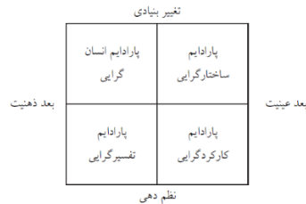
شکل ۱- پارادایم‌های جامعه‌شناختی بورل و مورگان (بورل و مورگان، ۱۹۷۹).