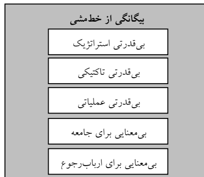
شکل ۱- چهارچوب مفهومی پژوهش.

در پژوهش حاضر به بررسی وجود بیگانگی مجریان از خطمشی‌های مالیاتی پرداخته شده است. از این رو چهارچوب مفهومی پژوهش در قالب شکل ۱ ترسیم و مبتنی بر آن فرضیه‌های آماری ذیل مورد آزمون قرار گرفت.