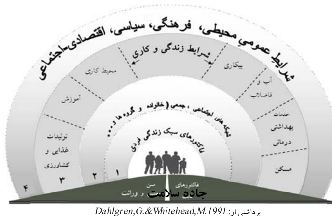
شکل ۲- شرایط عمومی محیطی، فرهنگی، سیاسی، اقتصادی-اجتماعی.

زیستی-اجتماعی آقایان وایت‌هد و دالگرن (۱۹۹۱) گرفته تا مدل تعیین‌کننده‌های اجتماعی نابرابری سلامت کمیسیون سازمان جهانی بهداشت (WHO, 2008) به صراحت بیان میدارند که سلامت در بطن زندگی روزمره مردم و از درون سیستم‌های پیچیده‌ای که وابسته به متغیرهای سیاسی، اجتماعی، اقتصادی و فرهنگی، فردی و زیستی هستند خلق می‌شود (شکل ۲) (Adam B, et al. 2014).