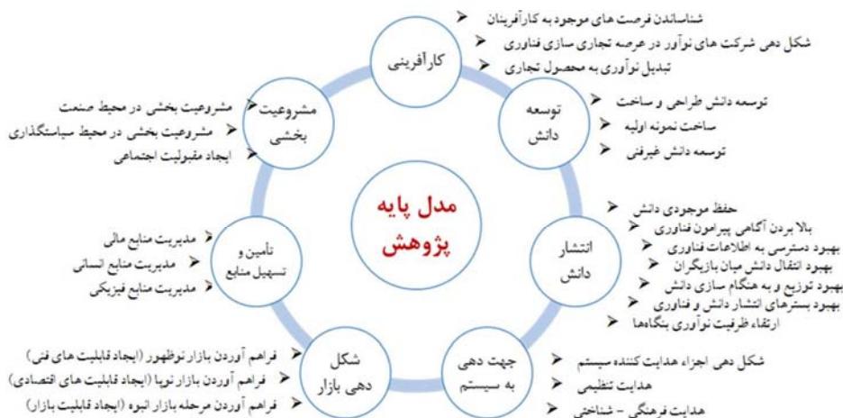
شکل ۱- کارکردها و زیرکارکردهای مدل پایه پژوهش (باقری مقدم، ۱۳۹۱؛ سورس و هکرت، ۲۰۰۹).

ادبیات، مدل توسعه این فناوری پیشنهاد شده است. از اینرو محقق در این پژوهش از میان مدل‌های موجود در نظام نوآوری فناورانه (ادکوئیست، ۲۰۰۵؛ هکرت، ۲۰۰۷؛ جاکبسون و برجگ، ۲۰۰۰)، مدل نظام نوآوری فناورانه سورس و هکرت (۲۰۰۹) را به عنوان کارکردهای اصلی مدل پایه تحقیق خود انتخاب نموده و با بررسی فضای پیل سوختی در ایران بدنبال تبیین نظام نوآوری فناورانه این فناوری در کشور می‌باشد. مطابق مدل سورس و هکرت، مدل پایه این تحقیق شامل ۷ کارکرد اصلی نظیر کارآفرینی ۱ ، توسعه دانش ۲ ، انتشار دانش ۳ ، جهت دهی به سیستم ۴ ، شکل‌دهی بازار ۵ ، تأمین و تسهیل منابع ۶ ، مشروعیت بخشی ۷ بوده و ۲۵ زیرکارکرد آن نیز از ادبیات این حوزه استخراج شده است. شکل ۱ نشان‌دهنده کارکردها و زیرکارکردهای مدل پایه پژوهش می‌باشد.