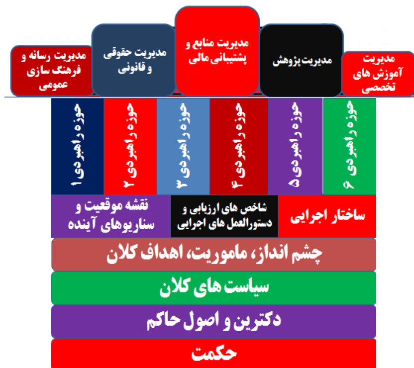
شکل ۲- الگوی معماری راهبردی (قسمت دوم)