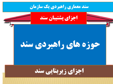
شکل ۱- الگوی معماری راهبردی ( قسمت اول)