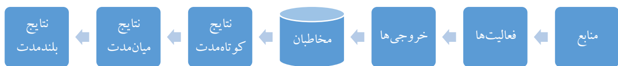
شکل ۲ - شکل عمومی یک مدل منطقی برنامه منبع: (McLaughlin & Jordan, 2015).

نظریه برنامه به معنای ساخت یک مدل معقول، پذیرفتنی و کاربردی است که نشان دهد چگونه یک برنامه «کار می‌کند» (Bickman, 1987). این مدل منطقی نقش مهمی در مفهوم‌پردازی، برنامه‌ریزی و ارتباطات در یک حیطة مشخص مرتبط با برنامه دارد و همچنین ابزاری برای طراحی ارزیابی برنامه و اندازه‌گیری کارایی آن است (McLaughlin & Jordan, 2015).