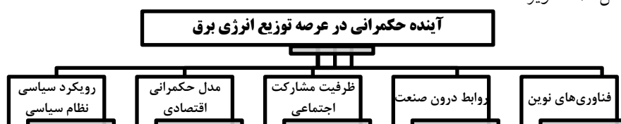
شکل ۱- پیشران‌های شناسایی شده در تدوین سناریوهای آینده حکمرانی در توزیع انرژی برق.

خروجی پنل خبرگان در این مرحله، شناسایی و تعیین پنج پیشران اصلی (عدم قطعیت کلیدی) است؛ مهم‌ترین پیشران‌های موثر در موضوع پژوهش، بر اساس مجموعه یافته‌های مراحل پیشین و نیز اخذ، جمع بندی و وفاق دیدگاه‌های خبرگان در پنل تخصصی (به شرح شکل ۱) تصویر شده است: