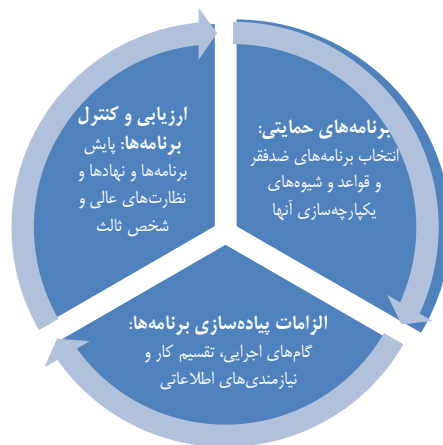
شکل ۳- اجزای حکمرانی حمایت اجتماعی (Bassett, et.al, 2012: 9).

بالای رشد و ایجاد تحول در ثروت عمومی، جهت حذف فقر و محرومیت به جریان می‌اندازد (Drèze & Sen, 1991: 22). از این رو حمایت اجتماعی با گذار از بسته نجات برای فقر، نوعی سرمایه‌گذاری برای توسعه سرمایه انسانی در آینده و نیز ابزاری برای کاهش وقوع فقر و آسیب‌پذیری محسوب می‌شود (Handayani & Burkley, 2009: x). در سطح میانی، حکمرانی حمایت اجتماعی به عنوان منطبق مداخلات حمایتی جهت ارتقای پوشش جمعیت در فقر، ارائه خدمات باکیفیت و دستیابی به هدف توسعه انسانی که با کاهش خطا، تقلب و فساد در ترتیبات ساختاری همراه است، تعریف می‌شود (Giannozzi & Khan, 2011: 10-11). اجزای سه‌گانه حکمرانی حمایت اجتماعی در شکل ۳ آورده شده است.