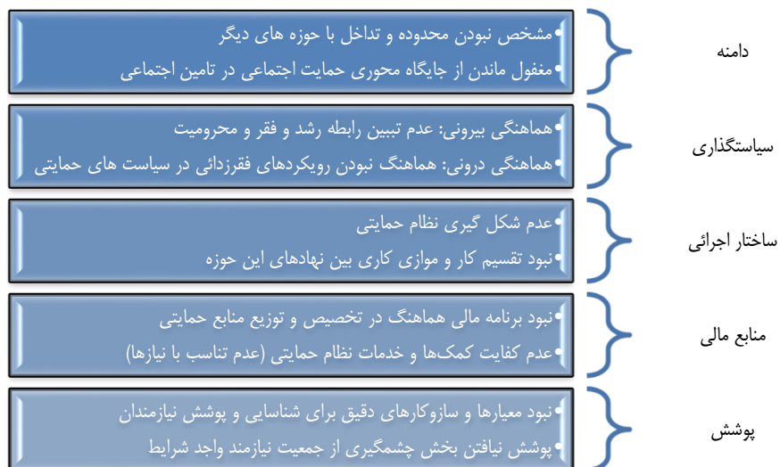
شکل ۱- خلاءها و نارسایی‌های وضع موجود نظام حمایتی.

عدالت اجتماعی و رفع فقر از جمله آرمان‌های انقلاب اسلامی ایران بوده است. تدوین و اجرای پنج برنامه توسعه، اقدامات حدود ۲۰ نهاد دولتی و عمومی جهت رفع فقر، صرف سالانه درصدی از تولید ناخالص داخلی و ... در این راستا بوده است. در نتیجه این تدابیر، هرچند بهبود در برخی شاخص‌های فقر و محرومیت نسبت به ابتدای انقلاب رخ داده است؛ ولی در وضعیت کنونی شاهد فقر خشن ۵,۵ درصدی (Worldwide, 2016) و فقر مطلق ۱۲,۳۱ درصدی (عینیان، ۱۳۹۶) هستیم. همچنین در شاخص‌های نابرابری نیز ضریب جینی حدود ۳۹ درصد و سهم ده درصد ثروتمندترین به ده درصد فقیرترین ۱۳ درصد است (مرکز آمار ایران). همه این شواهد نشان می‌دهد که اقدامات فقرزدایی در این چهار دهه کارا و اثربخش نبوده است. سوال اینجاست که کدام لایه رفاه و تامین اجتماعی به طور مستقیم این هدف و آرمان را بایستی تعقیب نماید. براساس «قانون ساختار نظام جامع رفاه و تأمین اجتماعی» (۱۳۸۳)، قانون برنامه پنجم و ششم توسعه، سند سیاستی «نظام تامین اجتماعی چندلایه کشور»، احکام دائمی برنامه‌های توسعه و...، وظیفه فقرزدایی برعهده لایه حمایت اجتماعی از نظام تامین اجتماعی چندلایه است. اما این لایه با کاستی‌هایی به شرح شکل ۱ مواجه است.