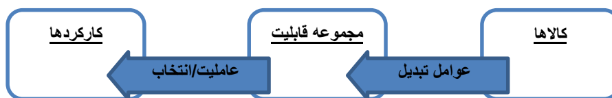
شکل ۵- پنج مؤلفه ساختاری رویکرد قابلیت (Goerne, 2010: 7).

در از بین بردن موانع در زندگی شان باشد؛ به طوری که آن‌ها آزادی بیشتری را در زندگی احساس کنند. بنابراین تحلیل کلیدی رویکرد قابلیت، ایجاد تمایز بین ابزار و اهداف بهروزی ۱ است، به طوری که سیاست‌ها را بر مبنای تأثیرشان بر قابلیت‌های افراد ارزیابی می‌کند (Robeyns, 2005: 95-6). رویکرد قابلیت، با پنج مؤلفه به شرح شکل زیر تشریح می‌شود و کاربرد آن‌ها در سیاستگذاری حمایت اجتماعی مورد بحث قرار می‌گیرد.