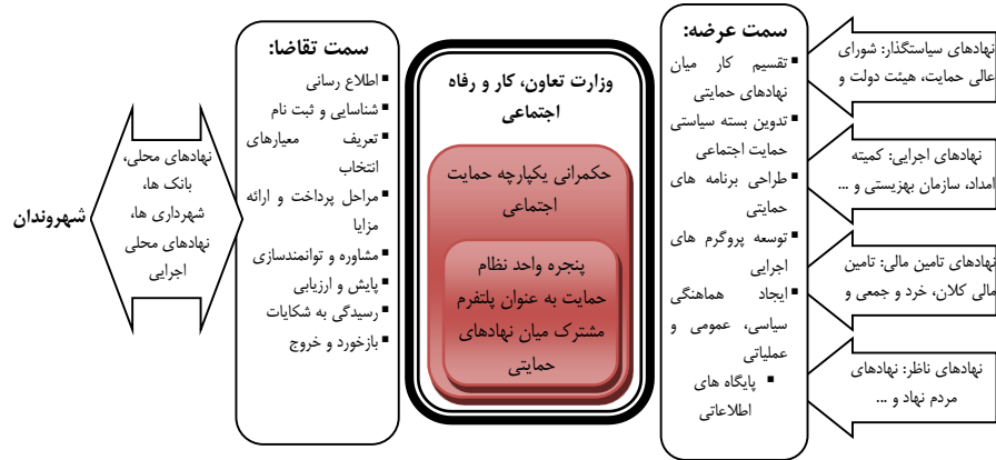
شکل ۷- پنجره واحد نظام حمایتی به عنوان مرکز ثقل نظام حمایتی.

بدیهی است که تولید نظام حمایتی با وزارت تعاون، کار و رفاه اجتماعی است که وظیفه اصلی آن پیاده سازی حکمرانی حمایت اجتماعی و پنجره واحد خدمات حمایتی است. جهت گیری وزارتخانه بایستی به سمتی باشد که از یک طرف بر توانمندسازی فقرا تمرکز کند و از طرف دیگر صرفاً بستر یا پلتفرمی را برای فقرزدایی مهیا نماید تا اینکه خود رسماً اقدام اجرایی انجام دهد. شاید ایده «دولت به عنوان پلتفرم فقرزدایی»، مسیری شفاف تر و با کارایی بالاتر را پیش روی نظام حمایتی قرار دهد که بتواند از پتانسیل و مشارکت کنشگران بیشتری علی الخصوص بخش خصوصی و غیردولتی در این راستا بهره برد. مجموعه توصیه های مبتنی بر تغییرات سیاست ها و برنامه ها و همچنین ساختار اجرایی نظام حمایتی در جدول ۴ آورده شده است.