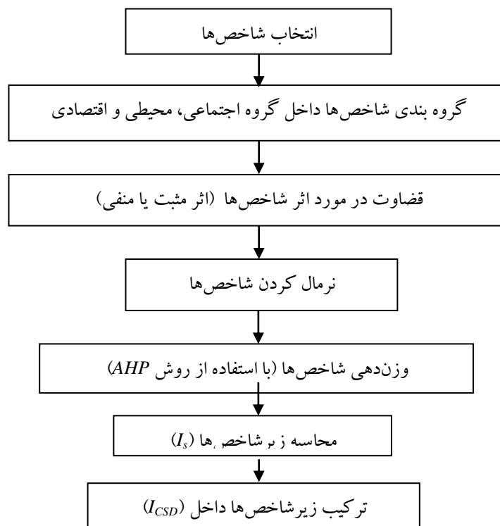
شکل ۲- روش محاسبه ICSD