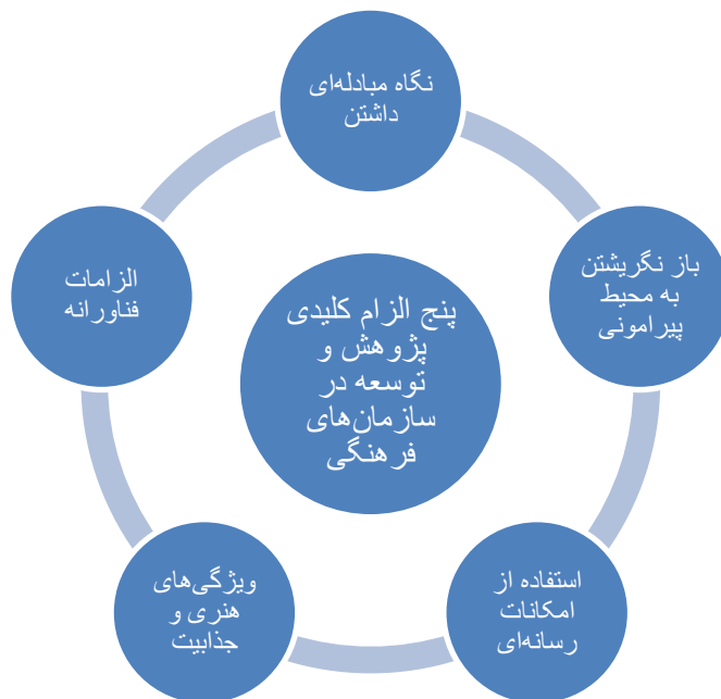
شکل ۲- پنج الزام کلیدی پژوهش و توسعه در سازمان‌های فرهنگی